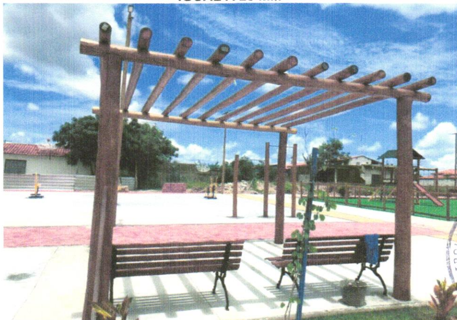
FOTO 02 – BANCO DE MADEIRA COM ENCOSTO EM EUCALIPITO TRATADO E FORNECIMENTO DE PEÇA DE EUCALIPITO TRATADO, D= 19 A 22CM, L= 4,00 M (MOURÕES)