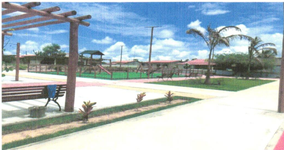
FOTO 01 – GRAMA ESMERALDO EM PLACAS, FORNECIMENTO E PLANTIO E FORNECIMENTO E INSTALAÇÃO DE GRAMA SINTÉTICA COM ALTURA MAIOR OU IGUAL A 20 MM