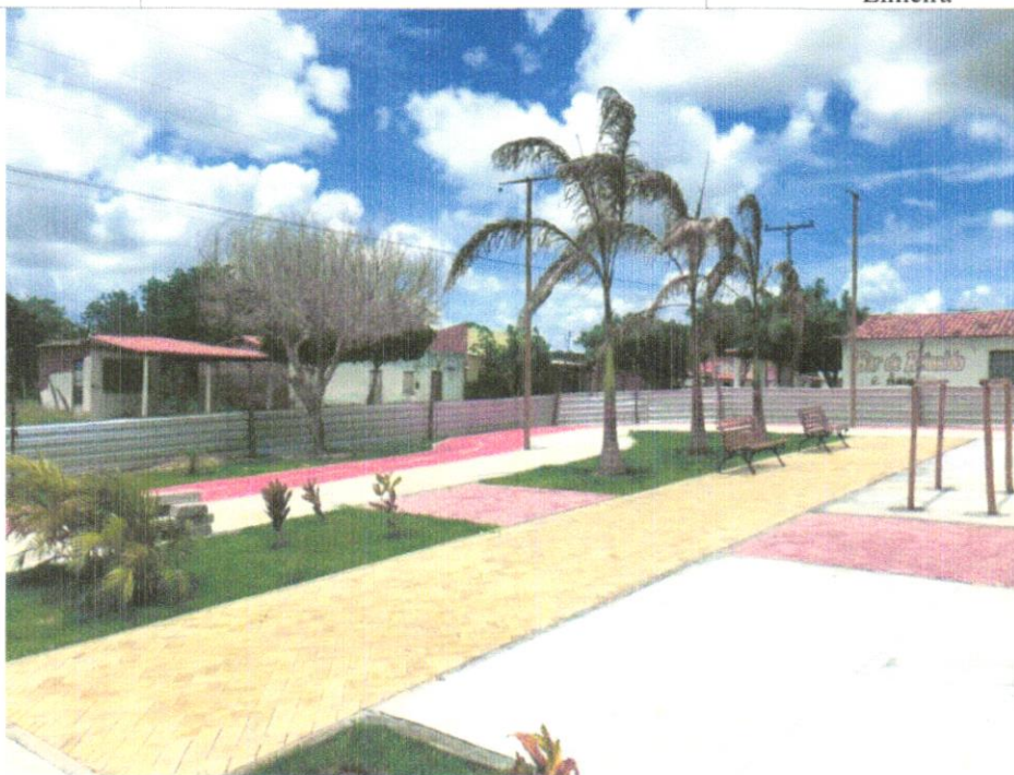
FOTO 03 - Planta - Palmeira Imperial h=4,00 a 5,00 m (fornecimento e plantio)

Evaldo Almeida Moraes Engenheiro Civil RNP 051417303-3