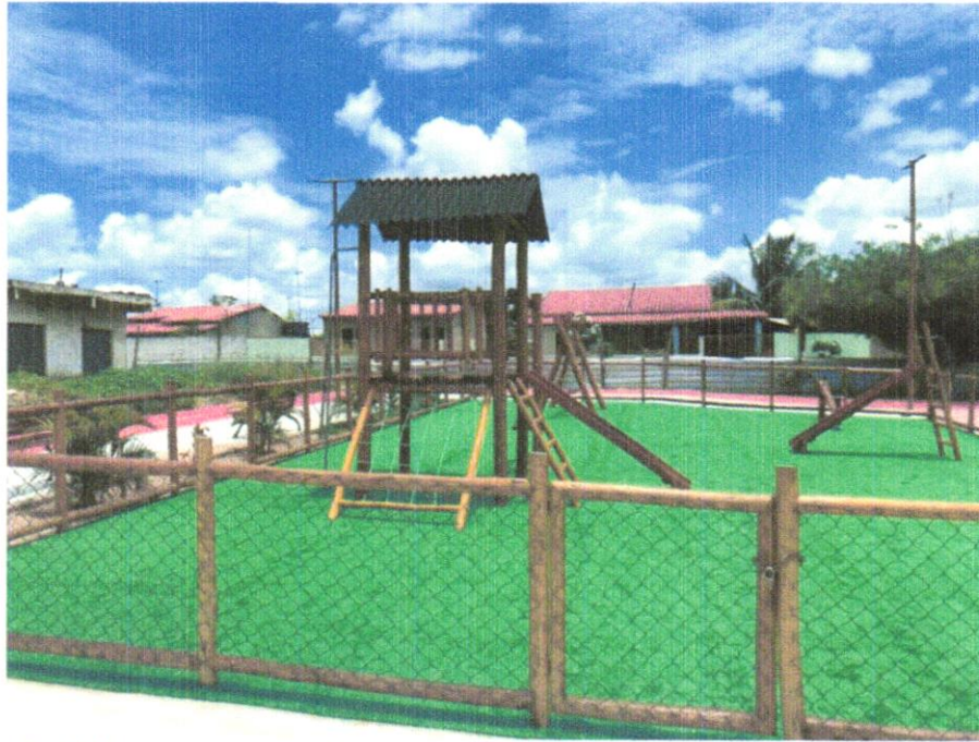
FOTO 07 – Fornecimento e assentamento de Casinha do Tarzan em eucalipto tratado, com pórtico de um balanço