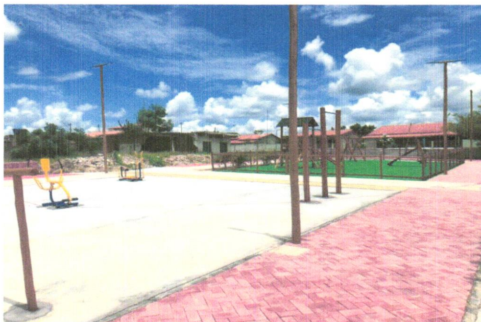
FOTO 05 – Fornecimento e assentamento de barra de apoio de 02 níveis em eucalipto tratado

Evaldo Almeida Moraes Engenheiro Civil RNP 051419303-3