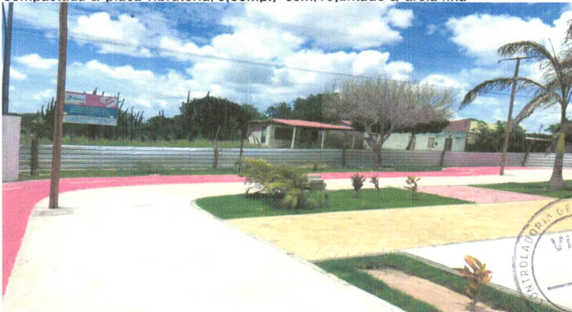
Foto 10 - Grama esmeralda em placas, fornecimento e plantio