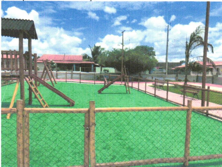
FOTO 08 – Fornecimento e assentamento de Escorregador em fibra com escada em eucalipto tratado, Fornecimento e assentamento de Balanço em eucalipto tratado e Fornecimento e assentamento de Gangorra em eucalipto tratado