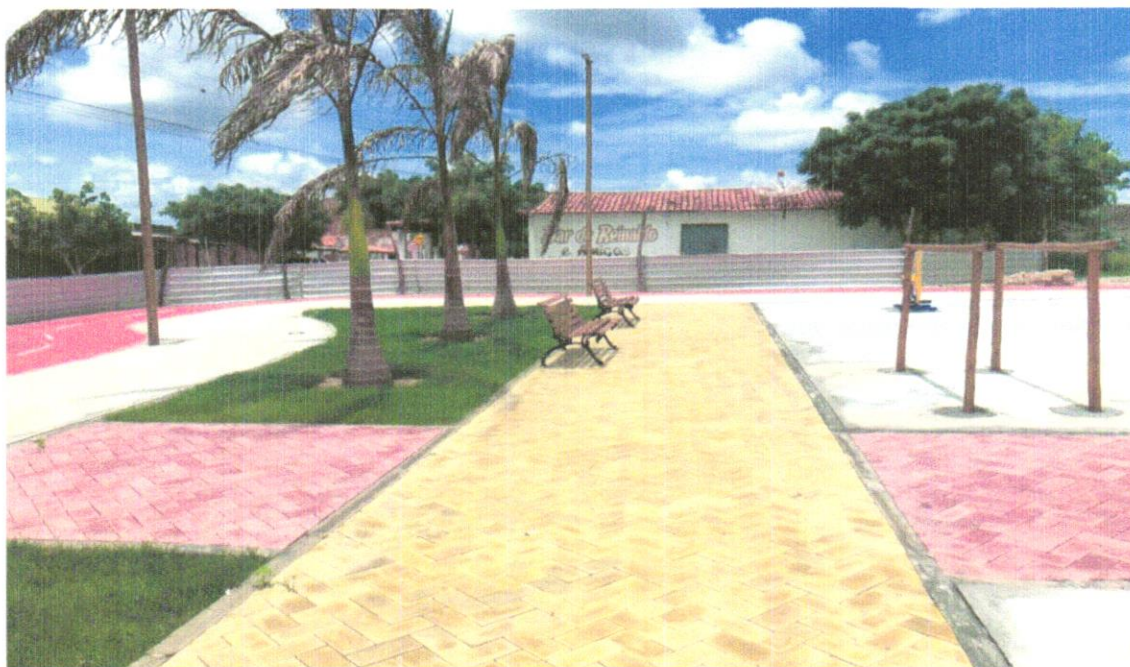
Foto 09 - Pavimentação em bloco de concreto vibroprensado, intertravado, colorido, 10x20cm, e=6cm, 46un/m2, NBR9781, Fck(min)=35MPa, sob coxim areia grossa compactada c/ placa vibratória, e(comp.)=6cm, rejuntado c/ areia fina